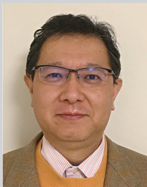
間 隆一郎 氏 厚生労働省大臣官房総括審議官

介護保険が始まった平成 12 年に、厚生労働省より和歌山県長寿社会推進課長としておいでいただいていた間氏のお声掛けにより、 それまで各振興局単位でばらばらだった介護支援専門員が県単位でまとまり、 20 年前の平成 14 年 3 月 16 日に和歌山県介護支援専門員協会が設立されました。 あれから 20 年以上が過ぎましたが、現在、厚生労働省の中核におられる間氏より、 介護保険制度や介護支援専門員のこれからのあるべき姿についてアドバイスをいただきます。